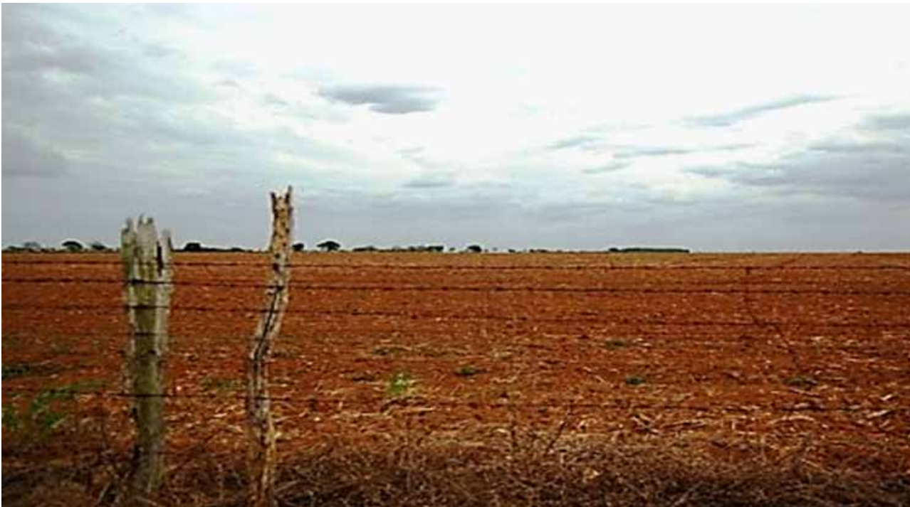
Paisaje que encontraron las familias cuando llegaron a la zona

La producción de una pequeña lechería familiar, resultado de un proceso de asentamiento con obstáculos, se ha convertido en la base sólida de una existencia familiar. Después de una fase de experimentación en el procesamiento de la leche y la comercialización de los derivados, se ha priorizado la venta de yogurt en el entorno inmediato. Toda la producción, cuando sale de la finca, prácticamente ya está vendida, sin llegar al mercado.