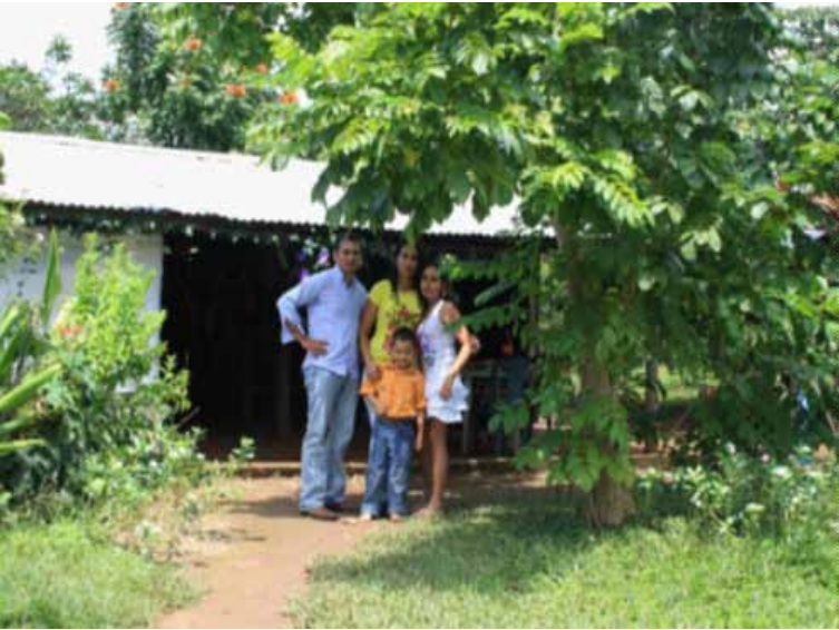
La familia unida